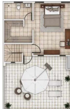
PLANTA 2DO. NIVEL