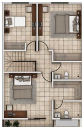
PLANTA 1ER. NIVEL